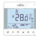
Bediening touch/LCD, inbouw