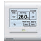
Bediening Easy touch/LCD